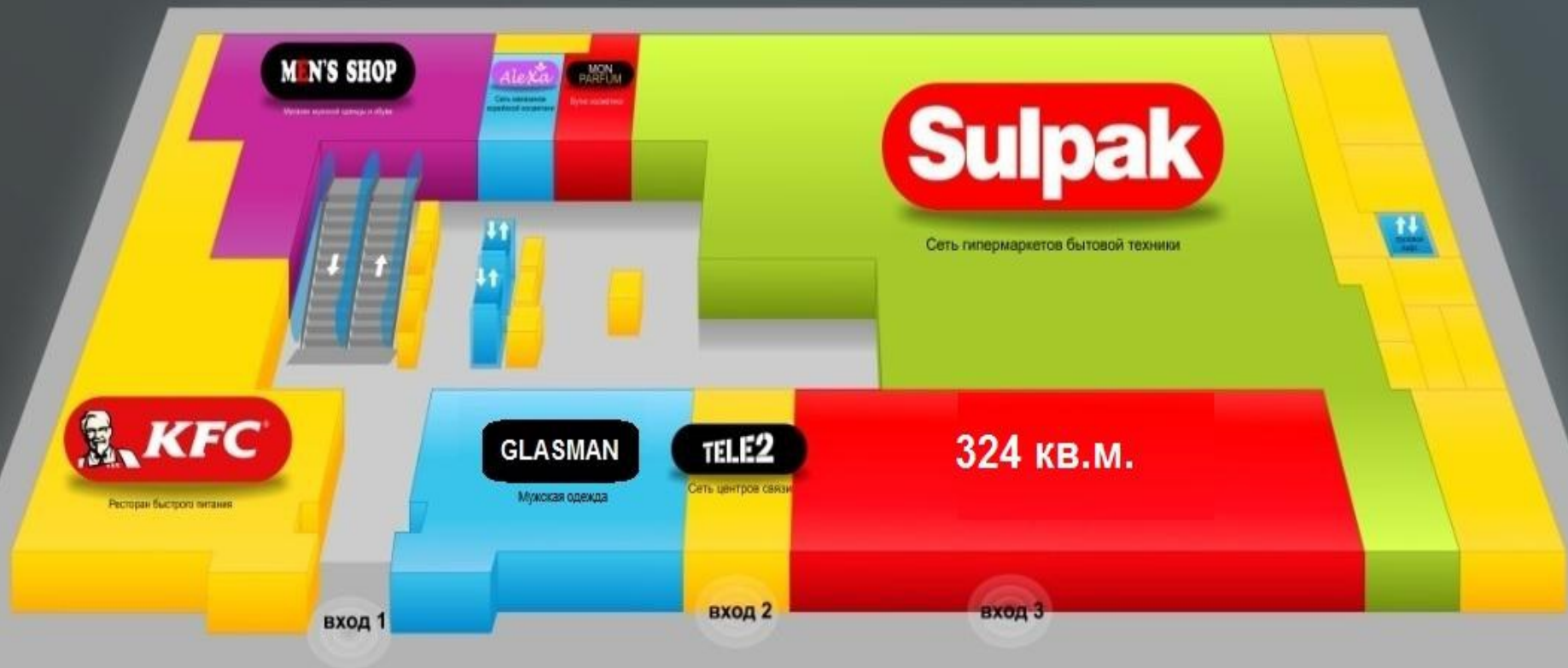
6. ПЛАН ЦОКОЛЬНОГО ЭТАЖА